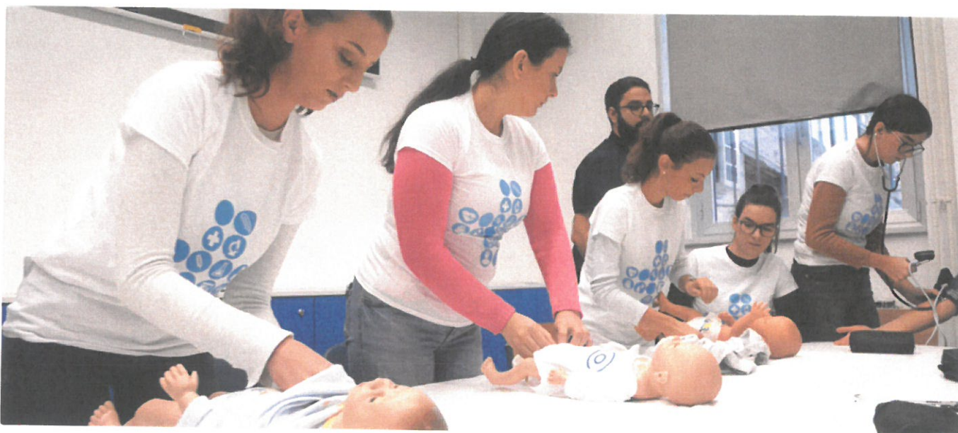
Studenti primaljstva

S obzirom na dugu povijest obrazovanja primalja u Rijeci, ne iznenađuje da je upravo Rijeka dobila i prvi diplomski studij primaljstva u Hrvatskoj. Primalje jako dugo nisu mogle nastaviti svoje obrazovanje na fakultetskoj razini, a Sveučilište u Rijeci je prvo pokrenulo preddiplomski stručni studij primaljstva, i to 2011. godine. Nakon toga su pokrenuli i sveučilišni diplomski studij Primaljstva. Primaljstvo je iznimno važno za zdravlje žena i djece, a mogućnost za visoko obrazovanje primalja značajno im doprinose.