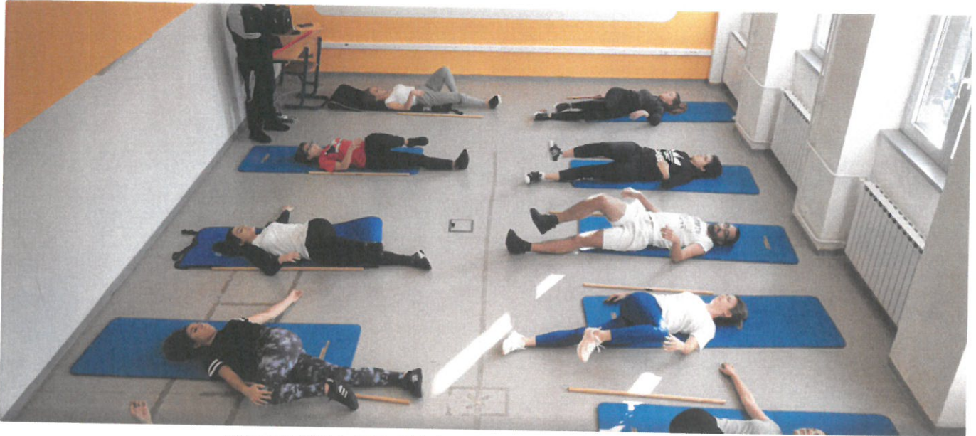
Studenti FZSRI-ja

sestre i tehničare koji lakše dolaze do posla.