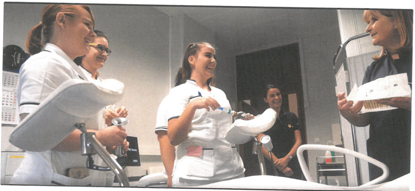
Studenti FZSRI-ja | Foto: Fakultet zdravstvenih studija Sveučilišta u Rijeci

Znate li koja zanimanja se ubrajaju u neliječnička zdravstvena? Znate li da neka od njih imaju zaista dugu povijest obrazovanja u Hrvatskoj? U suradnji s Fakultetom zdravstvenih studija Rijeka sastavili smo popis deset najzanimljivijih činjenica o studijima koji obrazuju ove stručnjake. Osim što biste mogli naučiti nešto novo, doznat ćete i kako je studirati na ovom Fakultetu.